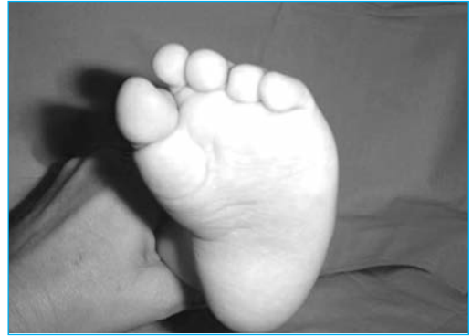
Figura 6. Pie metatarso varo

En la radiografía se observa el astrágalo vertical, paralelo a la tibia y el calcáneo en equino.