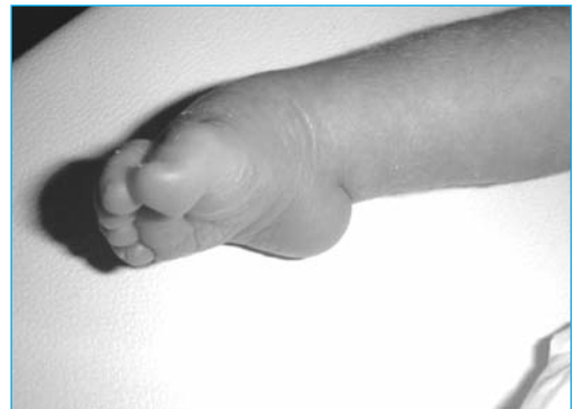
Figura 4. Pie equinovaro congénito

El pie valgo convexo o astrágalo vertical congénito es una malformación congénita que se caracteriza por una posición vertical del astrágalo con luxación de la articulación astrágolescafoidea. (Fig. 5)