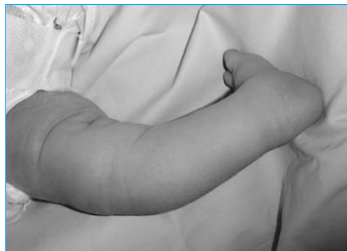
Figura 8. Genu recurvatum

En la exploración se observa una limitación de la rotación y lateralización de la columna cervical hacia el lado retraído. En ocasiones, puede palparse un abultamiento del músculo, que corresponde a un hematoma en el vientre muscular. En niños más mayores, que no han sido tratados, se aprecia una fibrosis con acortamiento muscular. En caso de persistir la deformidad, desarrollará una plagiocefalia.