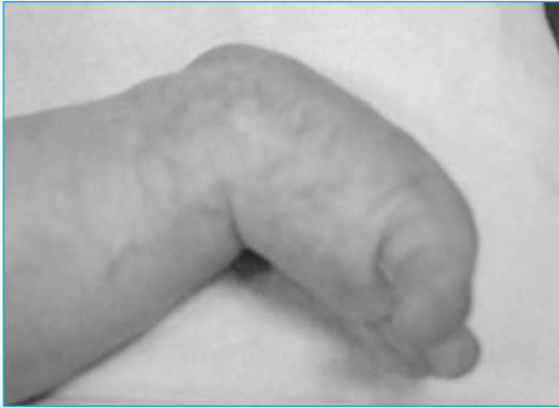
Figura 5. Pie astrágalo vertical congénito