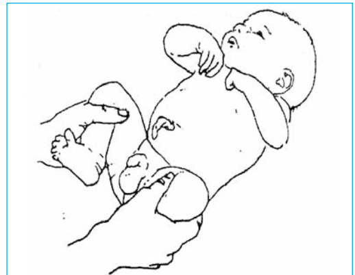
Figura 1. Maniobra de Ortolani

En niños más mayores se puede observar un acortamiento de la extremidad afecta o signo de Allis, que producirá una asimetría de