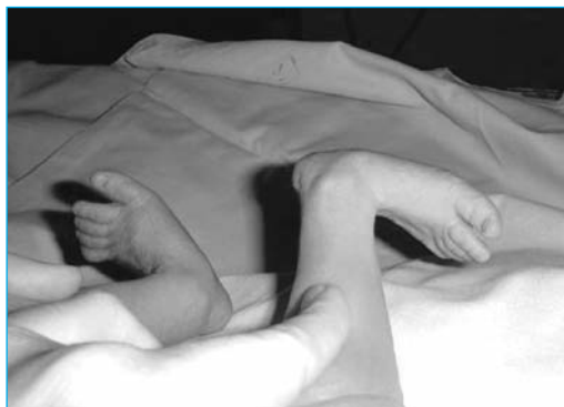
Figura 7. Pie talo-valgo

En la radiografía se puede apreciar un desplazamiento anterior de la tibia sobre el fémur.